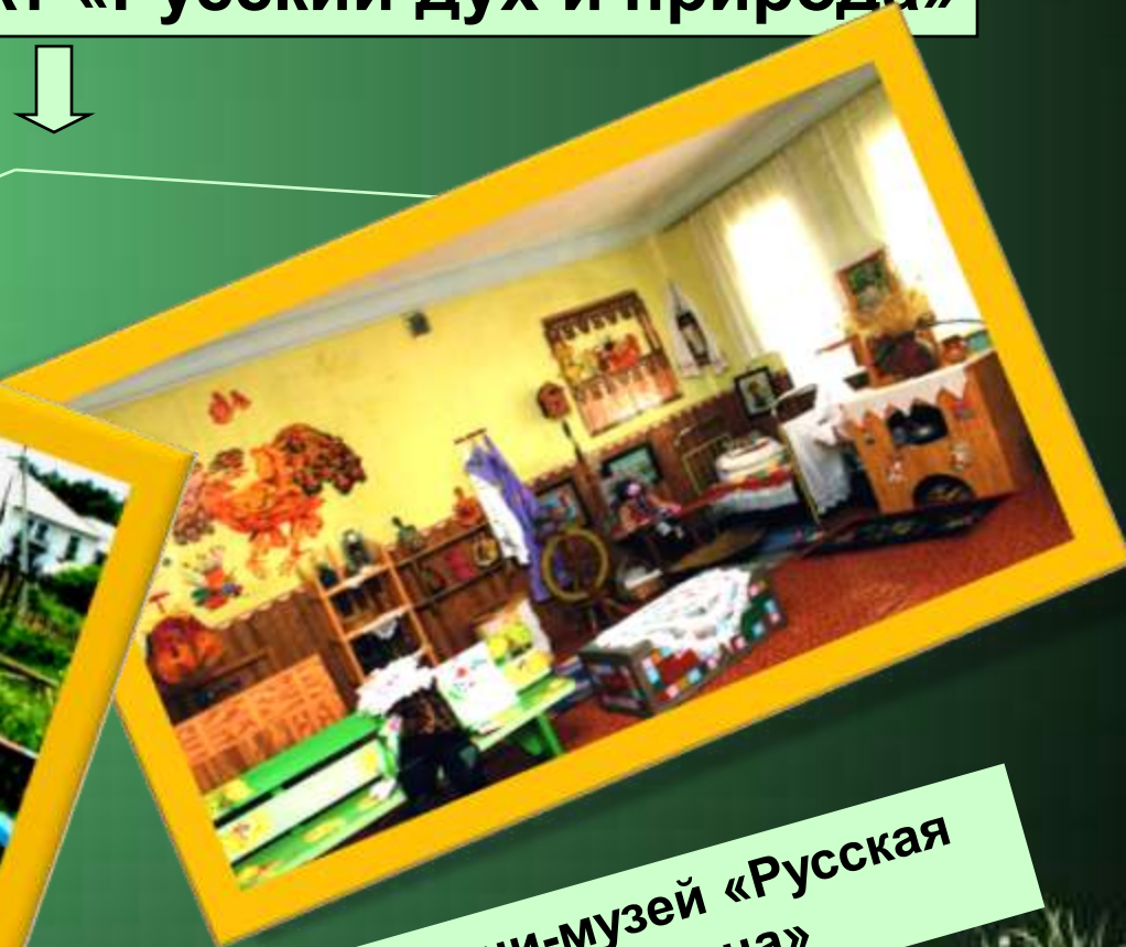
Мини-музей «Русская горница»